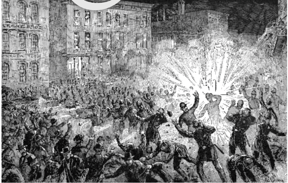
හේමාර්කට් වතුරාශ්‍රයේ බෝම්බ ප්‍රහාරය.